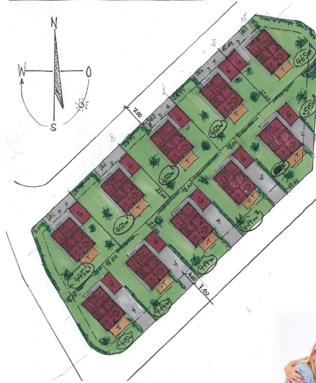
SKIZZE GRUNDSTÜCKSAUFTEILUNG 1:500